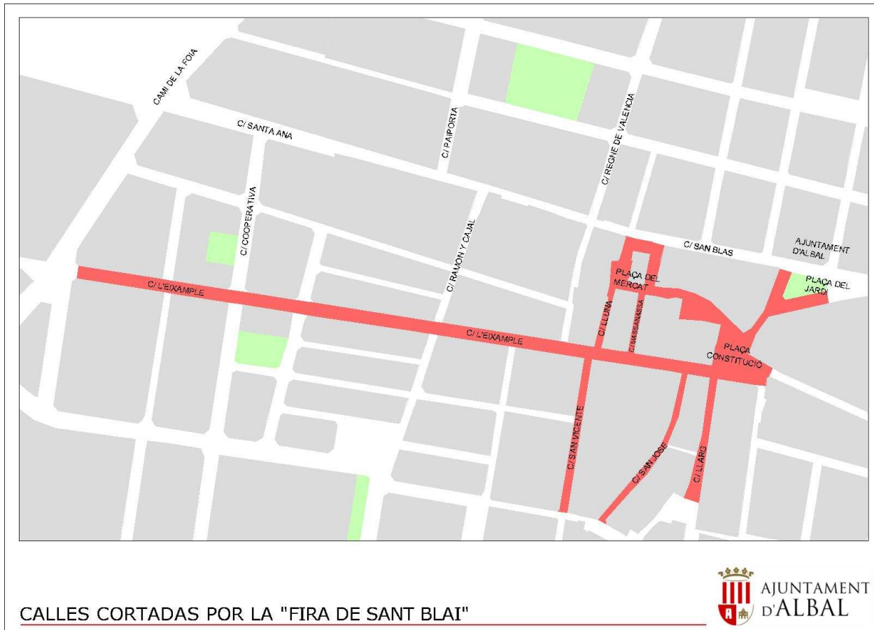
CALLES CORTADAS POR LA "FIRA DE SANT BLAI"

Area de ubicación de instalaciones desmontables de la Fira de Sant Blai (plano en formato pdf)